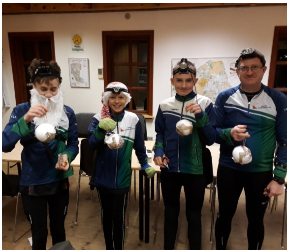
Årets juleafslutning hvor vi vanen tro løb et stykke julepynt – i 2020 var det en julekugle hvoraf banen fremgik

I beretningen plejer jeg at fremhæve løbere, udnævne årets ungdomsløber og klub-