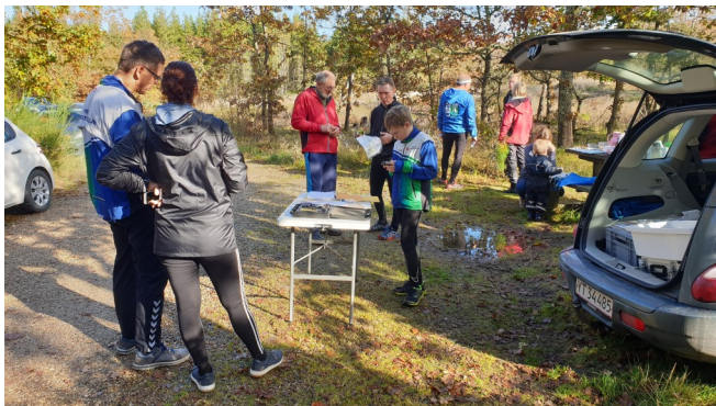
Træningsløb: En af de få gange vi kunne mødes.